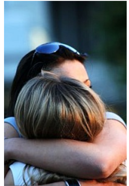
Manchmal übernehmen Kinder die Trösterrolle

Heikel ist es allemal, diese Kommunikation zwischen Kind, Eltern und Experten in die Wege zu leiten. "Kids Strengths" soll genau hier Unterstützung liefern. Die involvierten Berufsgruppen finden auf der Online-Plattform Modelle etwa für Hilfeplan-Besprechungen mit Eltern, Wissensmodule, eine Sammlung von